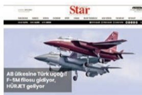
AB ölkəsinə Türk uçuşu F-5M flotu gəlir, HÜRJET gəlir

TUSAŞ daha əvvəl HÜRJET seriyalı ilk partiyasının 2027-ci ildə Türkiyə Hərbi Hava Qüvvələrinə təhvil verəcəyini bildirmişdi.